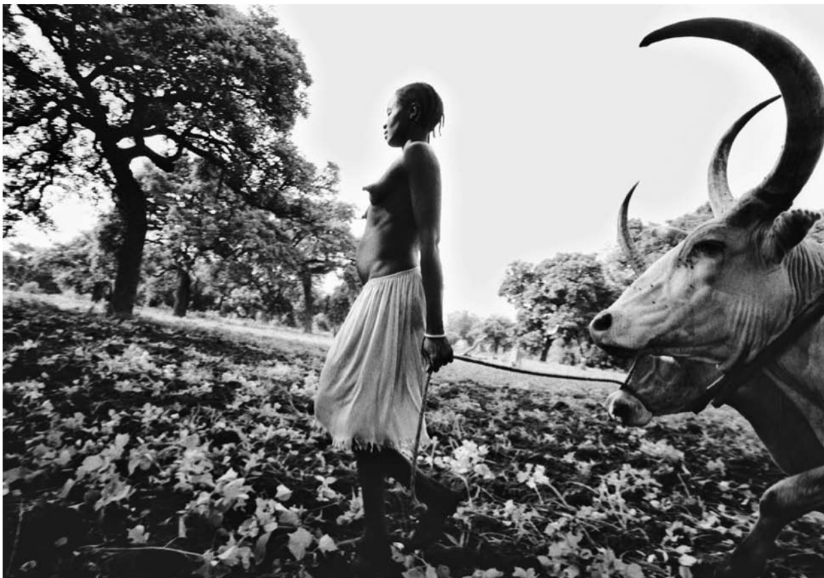
Nomadzi Nilu są światem bez hierarchii, podzielonym między dziesiątki plemion, z którymi rzadko wchodzi w alianse. Autorytet należy do osoby, do tego, kto potrafi rządzić chmurami deszczu, zaczarować, zatańczyć. Południowy Sudan.