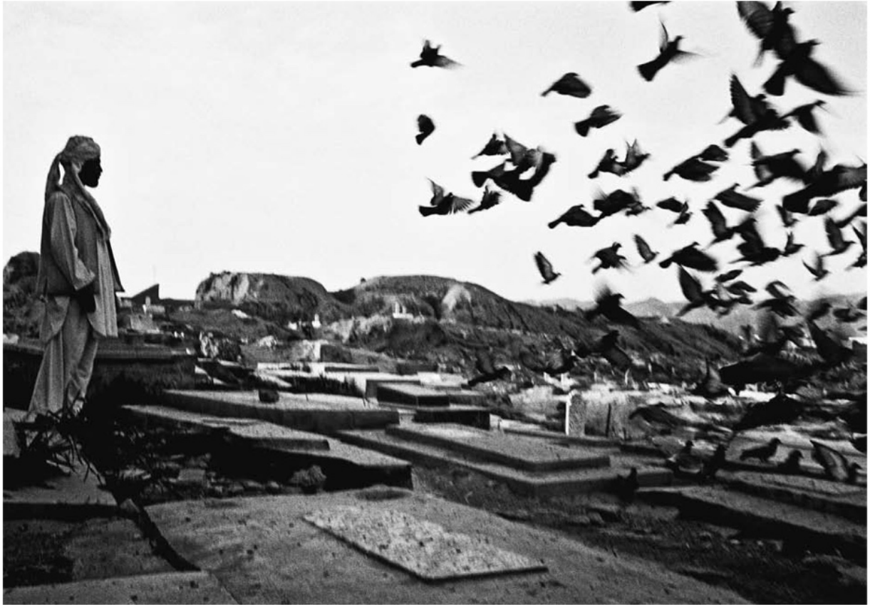
W niektórych grobach wyłobiona jest miseczka, na wodę dla spragnionych dusz. Opowiadają, że w co siódmym ptaku mieszka dusza zmarłego, więc na wszelki wypadek lepiej nakarmić wszystkie. Afganistan.