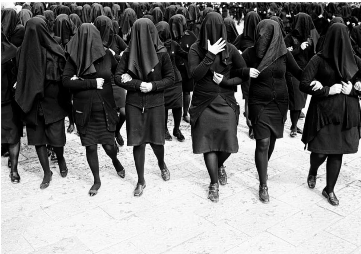
Tysiące apulijskich kobiet w czerni i jedna, potężna pieśń Stabat Mater , żaloba Demeter. Włochy.