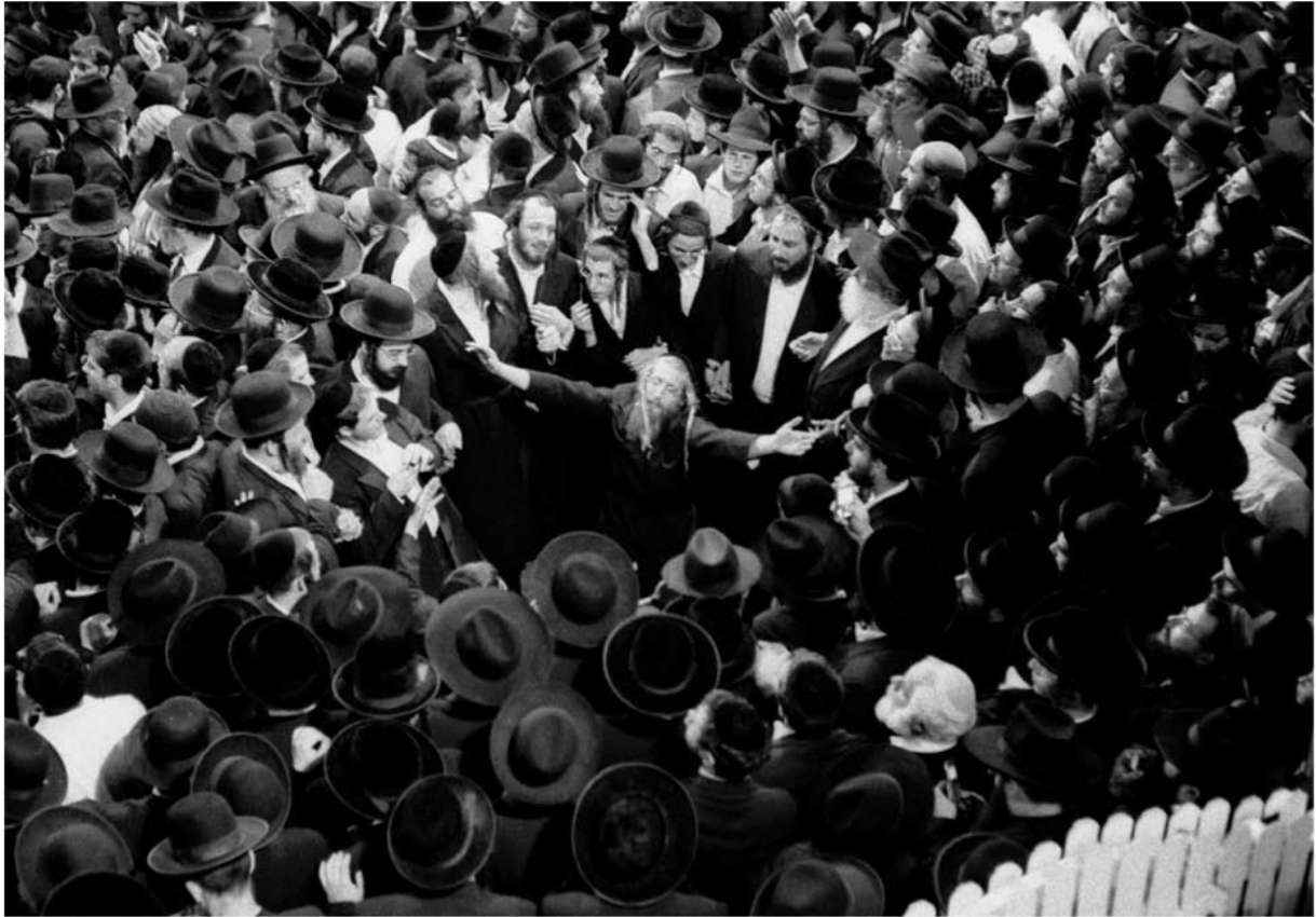
Humań daje rebemu Nachmanowi z Braclawia niepowtarzalną okazję, by związać zagubione, zaniedbane dusze w węzeł życia. Nachman wie, że tysiącami przyjdą na jego grób i ich modlitw starczy dla wszystkich dusz. Ukraina.