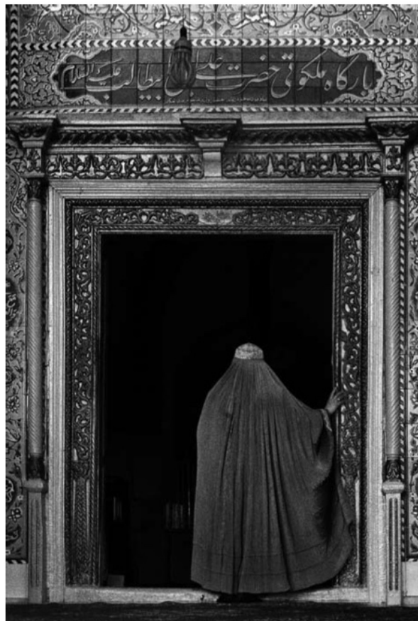
O zachodzie słońca płoną złotem inkrustacje fasady meczetu Alego, mitycznego pogromcy smoka i księcia kruszcza, patrona Kabulu.

* Jest to fragment książki Święte rozdroża , która we wrześniu 2017 roku wyjdzie po angielsku i włosku w wydawnictwie Contrasto (włoskiej filii agencji Magnum) a zaraz potem w Polsce.