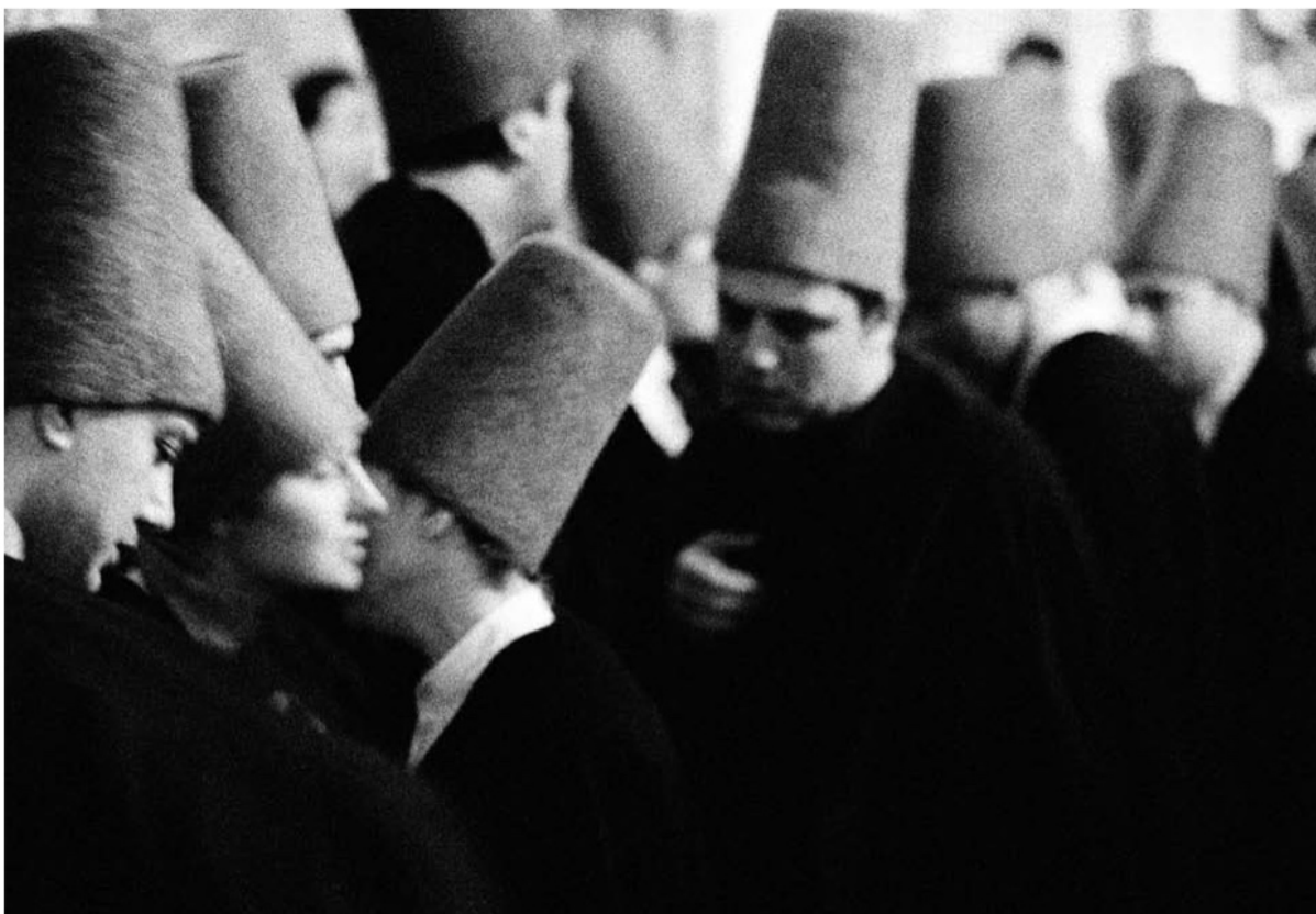
W Damaszku w meczecie Omajadów chronionego „minaretem Chrystusa”, chrześcijanie, szyici i sunnici modlą się przy grobie Jana Chrzciciela. Syria.