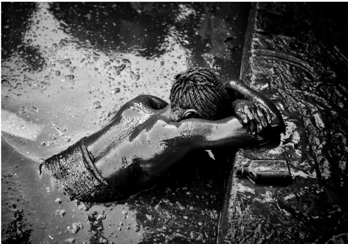
Haiti – lustro Afryki, siedziba bogów na wygnaniu, którzy prowadzą nas do dzieciństwa Europy i mitów Śródziemnomorza: do syreny, która wylania się w karaibskim piekle Hiszpanioli, Oguna wojowniczego jak Zeus, Legby, boga słowa, niczym Hermes.