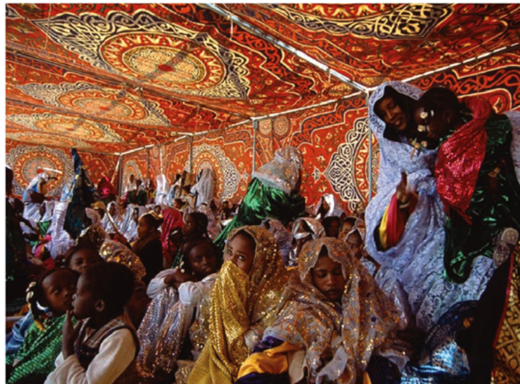
Οι Τουαρέγκ στο Γκατ, στη νοτιοδυτική Λιβύη, γιορτάζουν με μεγαλοπρέπεια το ιερό τους φεστιβάλ Σεμνέια. Με αφρικανικές, αϊθά και ισλαμικές ρίζες, σύμφωνα με τον μύθο χρονολογείται από τους φαραωνικούς χρόνους.

Σε τελική ανάλυση, ακόμη και ο άθεος Σίγκμουντ Φρόνιτ παραδέχεται ότι η θρησκεία έχει πρακτική χρήση: παρακινεί σε παραιτήση από «εγω-