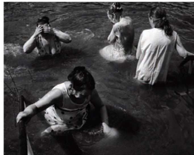
Με δυνατές προσευχές, οι προσκυντές βυθίζονται στα ευλογημένα νερά του Βιάτκα. Πιστοί από όλη τη Ρωσία πραγματοποιούν προσκύνημα στις όχθες του ποταμού για να τιμήσουν τον εορτασμό του Αγίου Νικολάου.

Λέγεται ότι πραγματοποίησε περισσότερες από 70 παρόμοιες αιωρήσεις. Τα περίεργα πλήθη θαύμαζαν αυτές τις αιωρήσεις. Η Ιερά Εξέταση, όμως, αντιμετώπισε με δυσπιστία τον «αιωρούμενο μοναχό» και, αφού τον κάλεσε σε απολογία, τον απομόνωσε τελικά σε