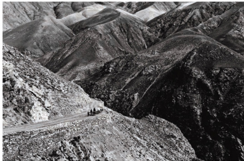
Στα βουνά του Αφγανιστάν οι άνθρωποι χάνονται, όπως αυτή η ισλαμική οικογένεια που περιπλανιέται κοντά στο χωριό της. Η θρησκευτική κοινότητα των ισλαμικών ανήκει στο σιτικό Ισράμ.

Μετά τη διάλυση της Σοβιετικής Ένωσης, στη Ρωσία επαναλειτούργησαν χιλιάδες εκκλησίες.